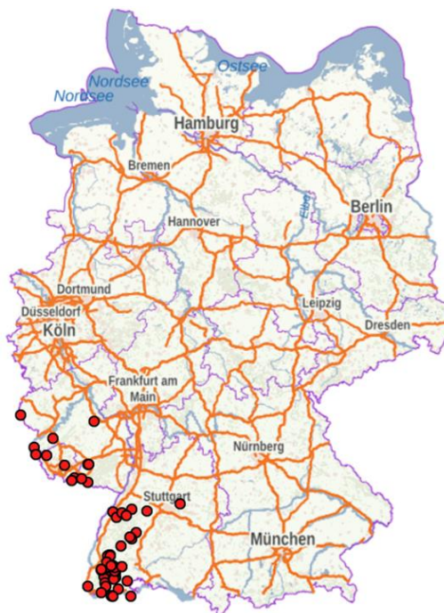
ABB. 1: BTV-AUSBRÜCHE 2018 – 2021 IN DEUTSCHLAND

Erfreulicherweise trat in BW seit Ende Mai 2019 aufgrund der zu diesem Zeitpunkt bestehenden hohen Impfdichte kein BTV-Ausbruch mehr auf. Seit dem 18. Juli 2022 gilt BW wieder als frei von BTV. Die Restriktionsgebiete und die damit verbundenen Handelsbeschränkungen konnten aufgehoben werden. Aufgrund nachlassender Impfwirkung sowie dem Abgang geimpfter Tiere nimmt bei gleichzeitig sinkender Impfbereitschaft zwangsläufig die Gesamtzahl der Tiere mit einem Schutz vor Infektionen mit dem Blauzungenvirus stetig ab. Im Umkehrschluss bedeutet dies, dass die Gefahr eines erneuten Ausbruchs ständig steigt.